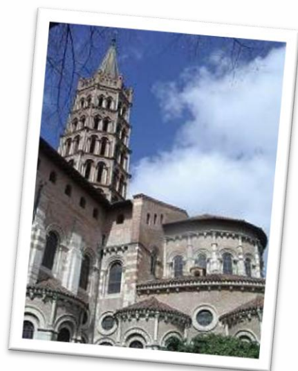
Arrivée à Toulouse