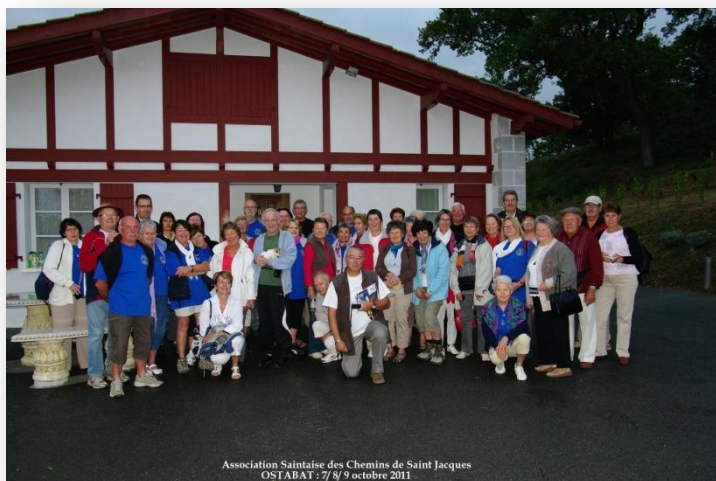
Association Sainlaise des Chemins de Saint Jacques OSTABAT : 7/ 8/ 9 octobre 2011

De la Vienne aux Pyrénées Atlantiques quel beau Chemin de fraternité pour fêter un tel anniversaire : rendez-vous en 2012 pour les dix ans du refuge ! Ultreïa !!!