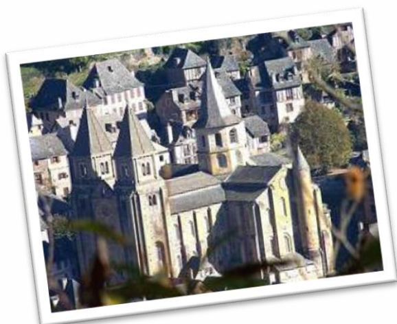
Départ de Conques